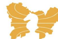
Club Deportivo Xadrez Ourense

Escola Municipal de Xadrez, Curso 2021-22